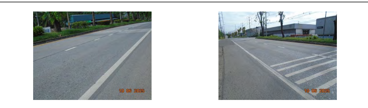
รูปที่ 1.3-7 ระบบถนน

ถนนในนิคมฯ แบ่งเป็น 2 ประเภท คือ ถนนสายประธาน ออกแบบให้สามารถรองรับปริมาณการจราจรแบบ heavy traffic เป็นถนนลาดยาง มีขอบเขตทางกว้างไม่น้อยกว่า 40 เมตร จำนวน 4 ช่องจราจร และถนนสายโท (สายรอง) ออกแบบให้สามารถรองรับปริมาณการจราจรแบบ medium traffic มีผิวจราจรลาดยางชนิด asphaltic concrete มีขอบเขตทางกว้าง 25 เมตร จำนวน 2 ช่องจราจร