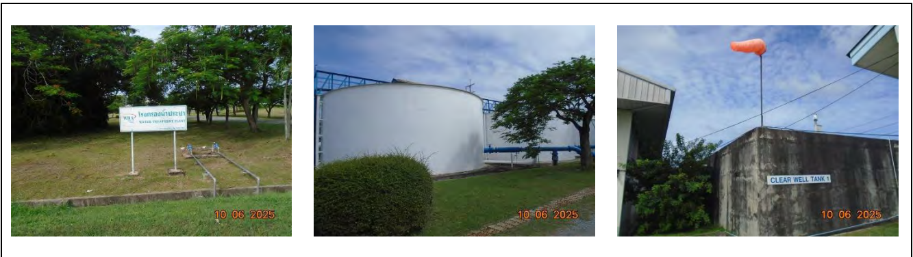
รูปที่ 1.3-2 โรงกรองน้ำประปา