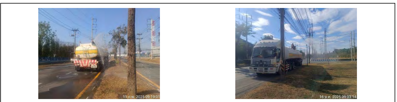
รูปที่ 1.3-5 การนำน้ำทิ้งที่ผ่านการบำบัดแล้วไปรดน้ำพื้นที่สีเขียว