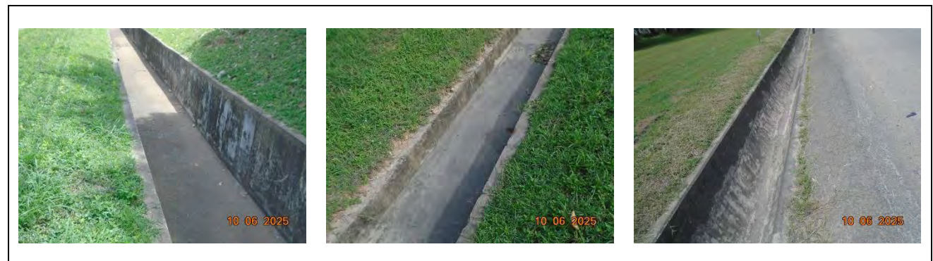
รูปที่ 1.3-3 รางระบายน้ำฝนภายในพื้นที่นิคมฯ

ระบบระบายน้ำฝนภายในพื้นที่นิคมฯ เป็นระบบระบายน้ำฝนแบบแยก (Separate System) คือ ระบบระบายน้ำฝนแยกกับระบบระบายน้ำเสีย และใช้รางระบายน้ำฝนเป็น U-ditch (รางเปิด)