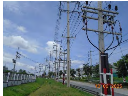
รูปที่ 1.3-8 ระบบไฟฟ้า