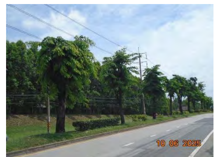
รูปที่ 1.3-9 พื้นที่สีเขียว