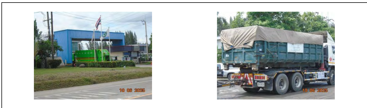
รูปที่ 1.3-6 ระบบกำจัดขยะมูลฝอย

ที่มา : ข้อมูลปริมาณกากของเสียที่โรงงานแจ้งไปยังกรมโรงงานอุตสาหกรรม ระหว่างเดือนมกราคม-มิถุนายน พ.ศ. 2568