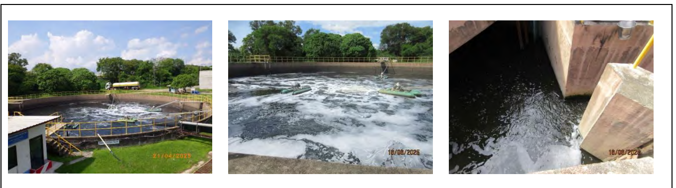
รูปที่ 1.3-4 ระบบบำบัดน้ำเสีย